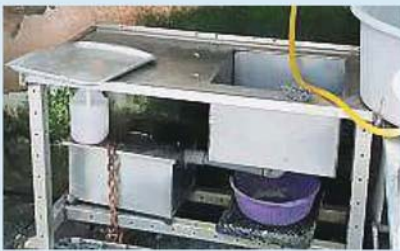
餐饮业者安装滤油器，有助减低沟渠堵塞问题。