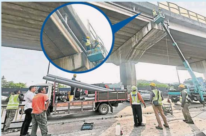
當局委派承包商更換巴生港口鎮軍營路上方公路橋的排水管，盼能減少雨天時，雨水從橋上傾瀉而下，導致軍營路易損壞問題。小圖為工友正逐一更換公路橋旁的排水管。

他上週親自視察更換工程，并向承包商負責人了解更換排水管的進度，希望此舉能一勞永逸解決雨水從公路橋上傾瀉而下，造成橋下軍營路容易被雨水侵蝕而毀壞的老問題。