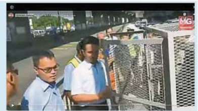
由於不堪總電箱的銅線一再被偷，有關當局只好花費3000令吉，為電箱裝設鐵籠防盜。(視頻截圖)