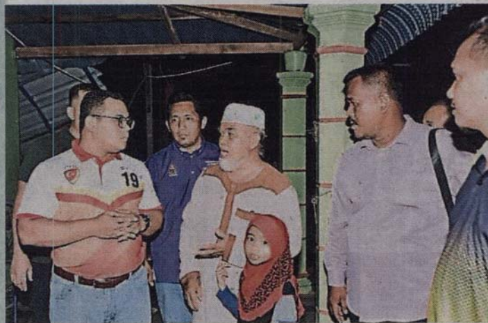
■ 阿米鲁丁（左）亲自到灾场慰问灾黎，并承诺州政府拨款150万令吉协助灾黎重建家园。