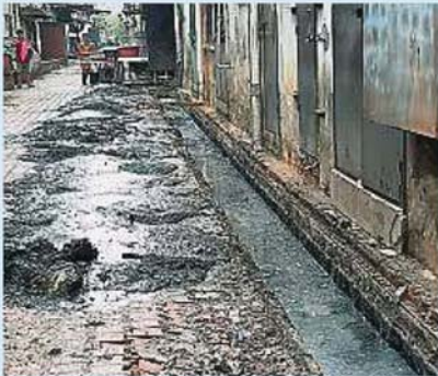
店寓后巷沟渠堵塞问题将近3年，沟渠囤积厚厚的油脂。