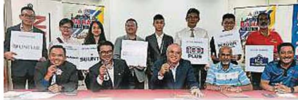
八打灵再也市政厅及雪州残障体育协会将举办“八打灵再也半程马拉松赛”。坐者中为八打灵再也市长拿督沙尤迪。