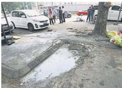
街边小贩不顾卫生，造成停车位与环境卫生恶劣。

士拉央市议员黄伟强今日和市议会各相关部门及工程承包商到甲洞逸福园第一区时，向路边小贩和非法扩建者发出