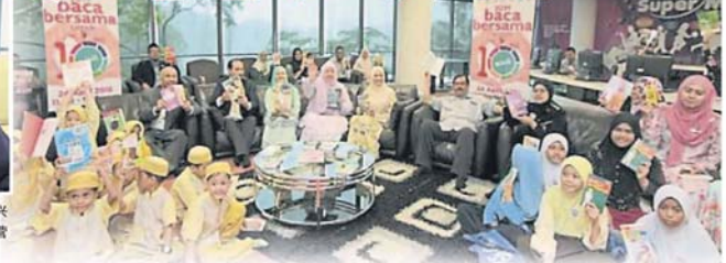
雪兰莪公共图书馆机构举办10分钟一起阅读活动，推广阅读风气。