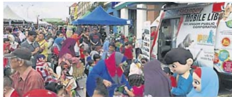
当局善用流动图书馆举办各种活动以吸引人潮。