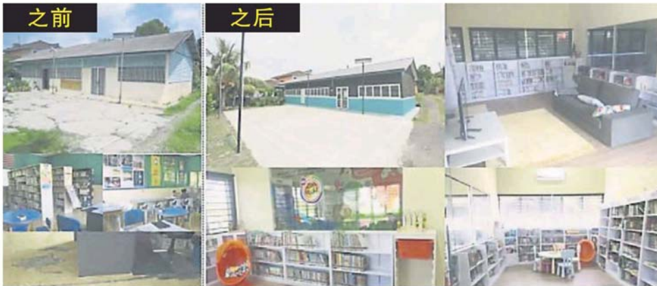
重塑的图书馆包括增设免费网络、电脑、会议室、休闲空间、洗手间、儿童阅览室等设施。