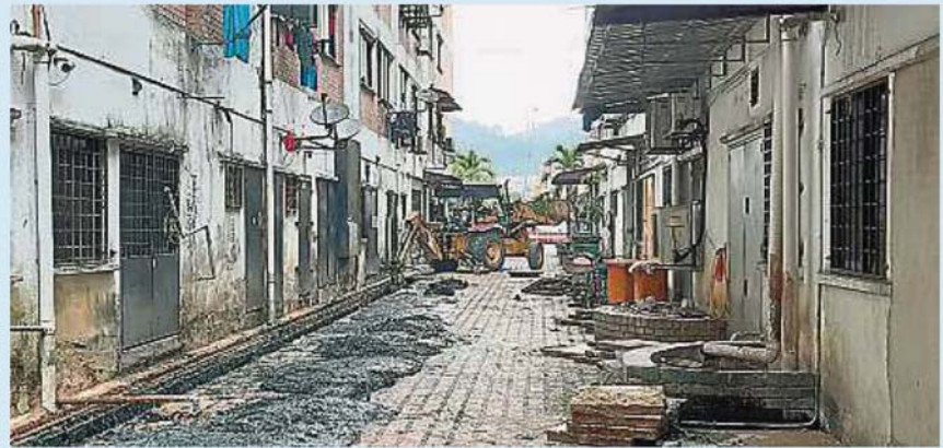
后巷一旦遇到大雨必定会积水，渠水溢出引发臭味令居民感到困扰。