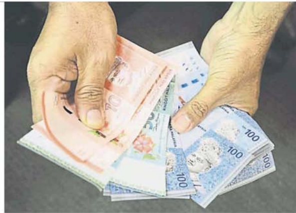
公司的现金是经年累月的累计而不是通过脱售主要资产一次性的现金累积。

纵观上述公司，公司的主要现金来自脱售生意，则有有很大的成数这些所谓的现金是看的到吃不到的陷阱。