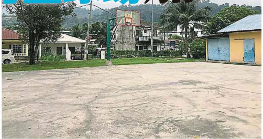
美丽村已有逾20年历史的篮球场饱受烈日曝晒，地面龟裂及球界线也模糊不清了。

“美丽村是鵝唛县内，篮球场仍未加盖的新村之一。除了加盖，拨款也将用以增建计分台、遮雨棚、照明灯，以及重新为球场上漆和画上已经剥落得看不见的球界线。此外，投篮板也会被粉刷一新，提振新村篮球队的士气。”