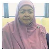
玛丝杜拉：州政府推广阅读兴趣之余，也希望在图书馆内营造充满爱与正能量的气氛。

“比如雪州书展、户外阅读活动教育嘉年华、流动图书馆、国文月、国庆日纪念等等活动，都是为了鼓励更多人加入阅读的行列。”