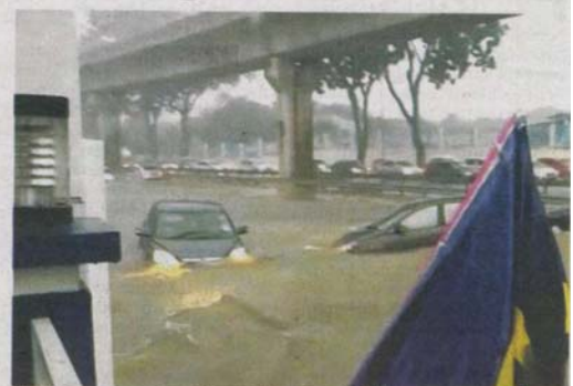
DUA buah kenderaan yang hanyut dalam banjir kilat yang melanda sekitar Persiaran Kewajipan menuju ke USJ di Subang Jaya semalam.

"Kesemua pemiliknya dilaporkan telah mendapatkan bantuan untuk menunda dan membaiki kenderaan masing-masing" katanya.