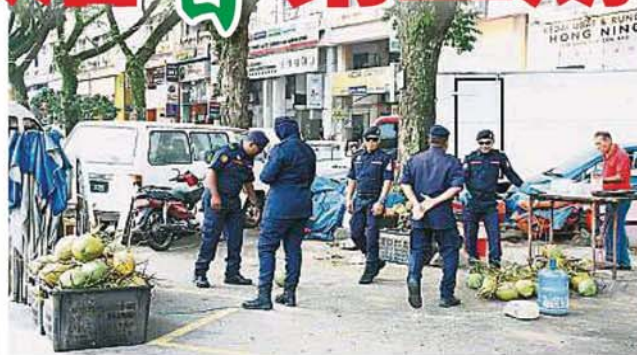
市议会对非法在路边摆摊的档口采取充公行动。

当局同时也对第二区的社区整合激活计划作出跟进，巡视以确保当地的商家不再有违例的情况出现。