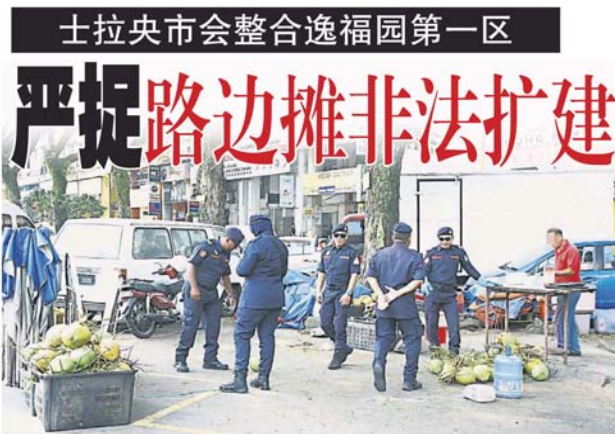
士拉央市议会各相关部门单位在行动中充公街边小贩的货品。